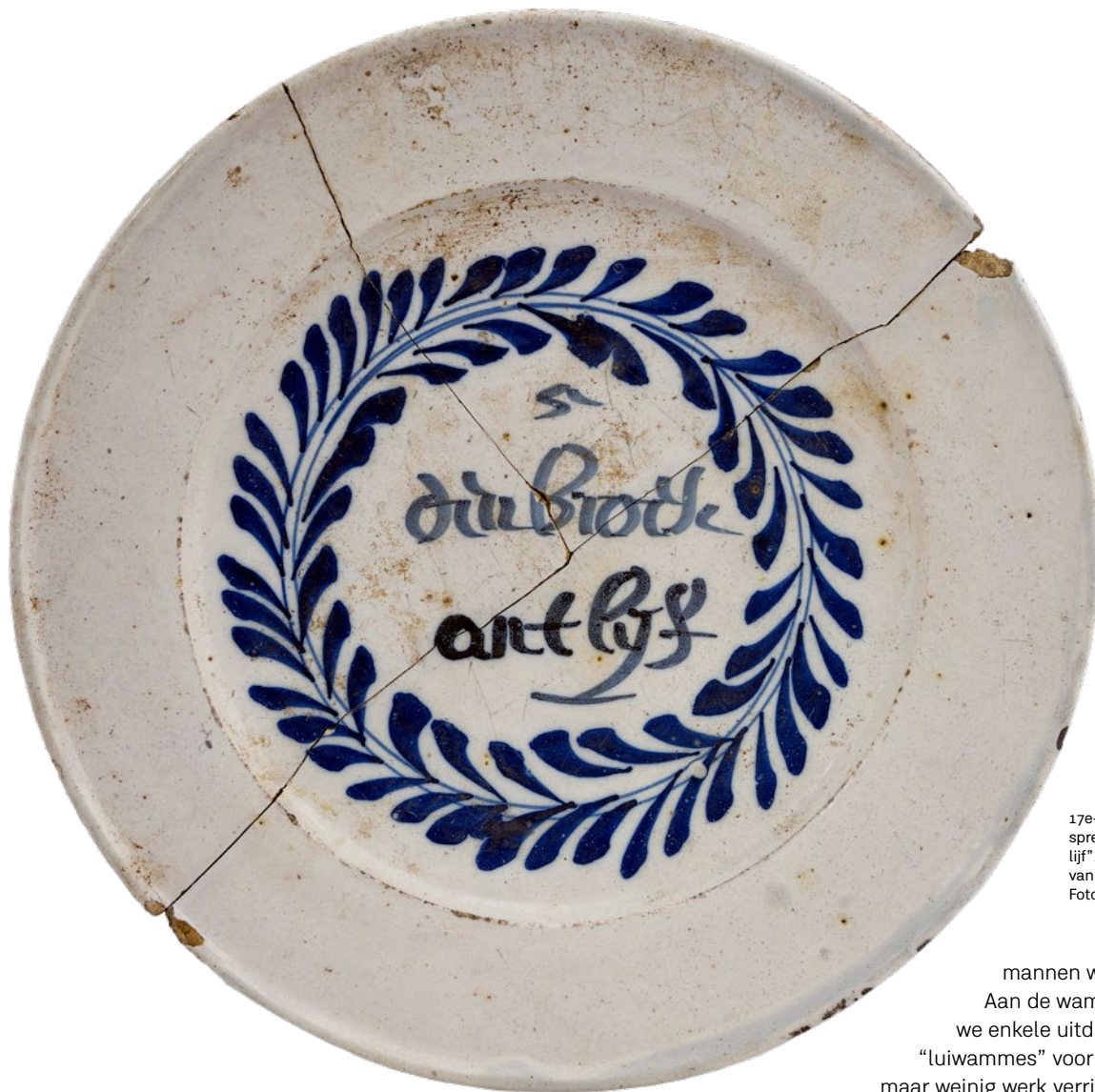
17e-eeuws genummerd spreukbord "den broek ant lijf". Het is de vijfde regel van een zesregelige vers.

standvlak. Ze hebben een diameter van ongeveer 22 cm. Decoratief bestaan er twee soorten spreukborden. Deze omringd met een lauwerkans zoals de exemplaren aangetroffen in Brugge, of deze omringd door een fries met overdadige symmetrische versiering (grotesken) aan weerszijden en een kroon erboven. Door het ontbreken van deze tweede variant in onze uitgebreide archeologische collectie, lijkt het erop dat deze tweede variant zijn weg naar Brugge niet heeft gevonden. Op het eerste zicht doen de borden wat vreemd aan. De tekstjes: "den broek ant lijf" en "als wel u zeegen wijs" zeggen ons niet veel. Dit komt omdat deze borden oorspronkelijk deel uitmaken van een serie van zes naast elkaar uitgestalde borden. Waarbij elk bord één tekstregel weergeeft van een zesdelige spreuk. Dit is te herkennen aan het nummer bovenaan de versregel. Bij de borden uit onze